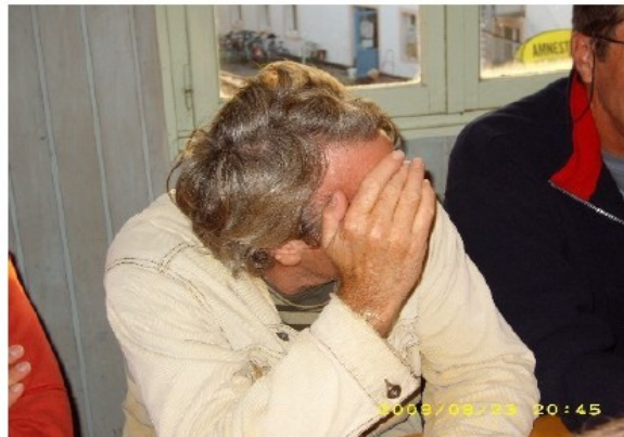
(ndlr : seule la honte du mauvais résultat explique, ce geste...)